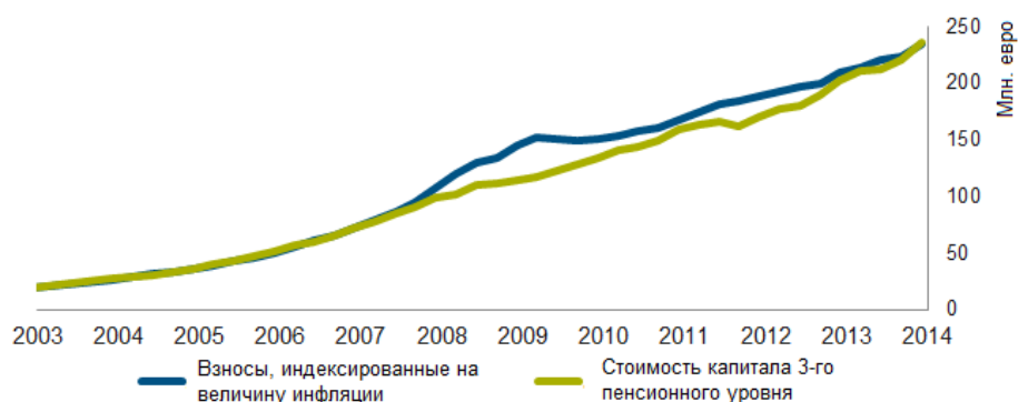
График № 3 Стоимость капитала 3-го пенсионного уровня и инфляция в Латвии