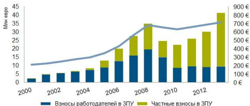
График № 1 Взносы в 3-й пенсионный уровень в 2000–2013 годах